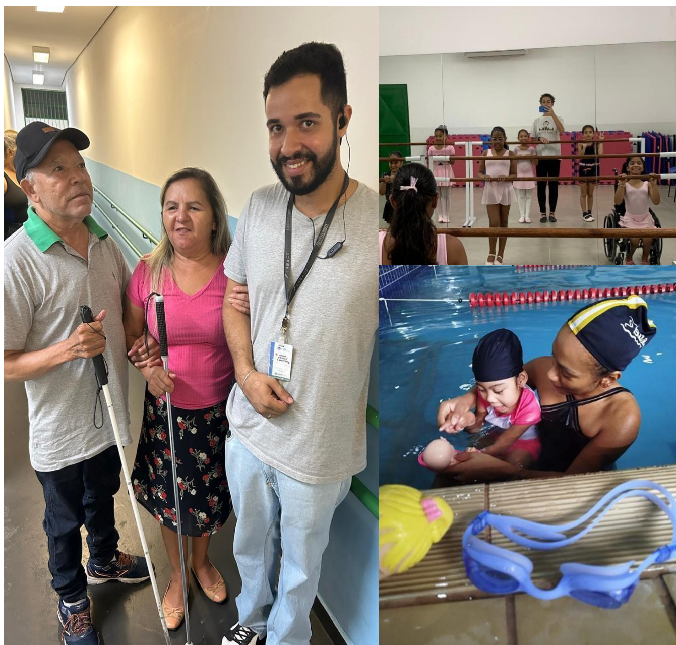
Acolhimento à diversidade nos espaços e atividades – respeito e acessibilidade.

Para criar um plano de trabalho para um centro de lazer e recreação com base na Lei de Inclusão (Lei nº 13.146/2015), é importante garantir que todas as atividades e infraestruturas promovam a acessibilidade e a inclusão de pessoas com deficiência. Com muito cuidado e acolhimentos, recebemos o público PCD, orientando os colaboradores e adaptando o espaço e as atividades com estratégia ativa para remover barreiras que impedem a participação plena de todos os cidadãos.