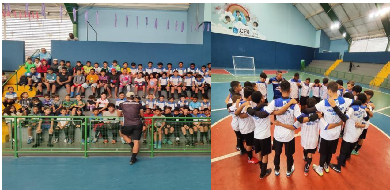
Projeto Alegria da Juventude – Iniciativa da comunidade – quadra sábados.

A realização de eventos que congregam diferentes organizações da comunidade desempenha um papel crucial na promoção do desenvolvimento social, esportivo e cultural. Estes eventos podem variar desde workshops, seminários, eventos educacionais, esportivos, culturais até festivais e ações de voluntariado. conforme cita o termo de Referência do Centro Unificado Dra Zilda Arns Neumann, pp.6 -7, OE-1, OE-2, OE-3.