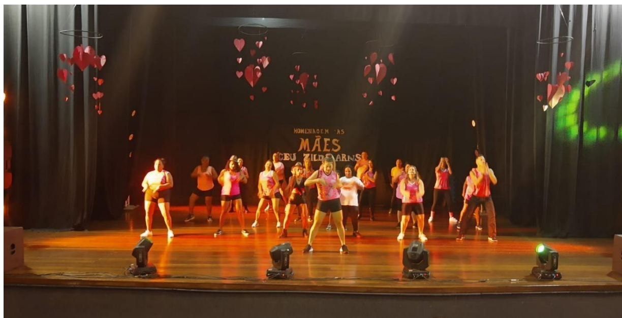
Apresentação de Zumba – Assoc. Delta – Maio 2024 – Empoderamento feminino