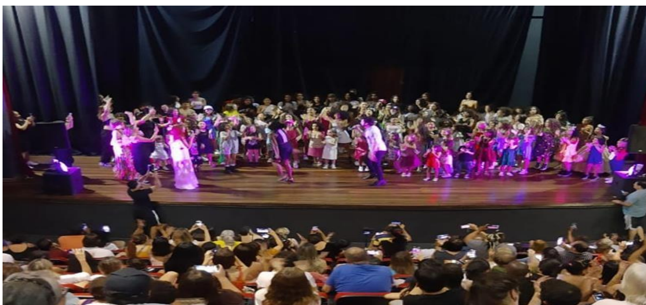
Desfile de moda – Abril de 2024 – trabalhando a autoestima dos envolvidos.